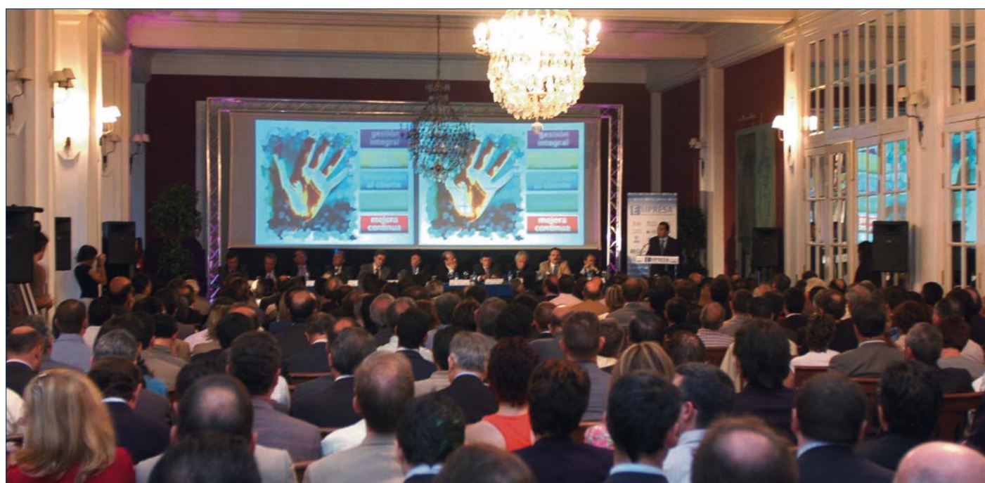
Acto de Presentación del Programa EMPRESA el pasado 11 de Junio.

MEJORA CONTINUA: Proporcionando un programa integral destinado a la mejora continua de las empresas que permita la actualización permanente de las empresas a las necesidades de los clientes y de los mercados.