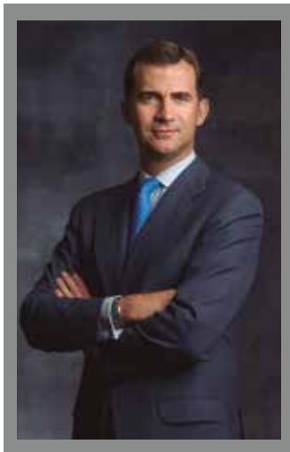
INTERVENCIÓN DE HONOR S.A.R. EL PRINCIPE DE ASTURIAS

FORO EUROPEO DE INDUSTRIA Y EMPRENDIMIENTO EUROPEAN FORUM FOR INDUSTRY AND ENTREPRENEURSHIP FORUM DE L'INDUSTRIE ET DE L'ENTREPRENEURIAT EUROPÄISCHES FORUM FÜR INDUSTRIE UND UNTERNEHMERTUM FORO EUROPEO DELL'INDUSTRIA E L'IMPRENDITORIA