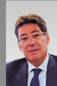
Arturo Aliaga Consejero de Industria e Innovación del Gobierno de Aragón