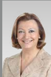
Luisa Fernanda Rudi Presidenta del Gobierno de Aragón