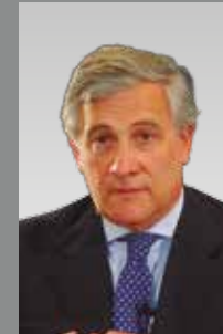
Antonio Tajani Vicepresidente de la Comisión Europea y Comisario de Industria y Emprendimiento