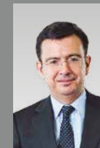
Román Escolano Presidente del Instituto de Crédito Oficial (ICO)