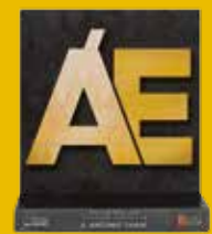
Antonio Tajani Vicepresidente de la Comisión Europea y Comisario de Industria y Emprendimiento