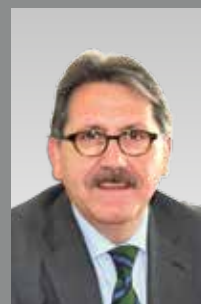
Manuel Teruel Presidente del Consejo Superior de Cámaras de Comercio de España