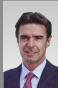
José Manuel Soria Ministro de Industria, Energía y Turismo del Gobierno de España