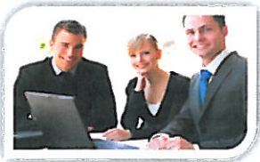
Innovando con las personas