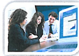
Planificando estrategias acordes a nuestro entorno