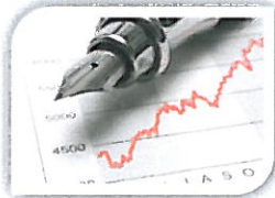
Mejorando el control de nuestra gestión