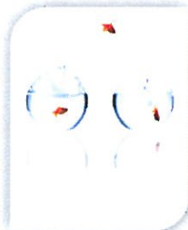
Manteniendo los procesos muy vivos