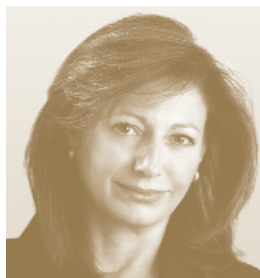
Mª Ángeles Delgado Directora General de Fujitsu Iberia y Presidenta de Fujitsu para Latinoamérica