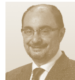
Javier Lambán Presidente de Aragón