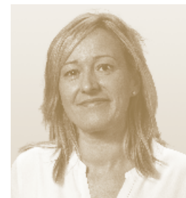
Marta Gastón Consejera de Economía, Industria y Empleo del Gobierno de Aragón