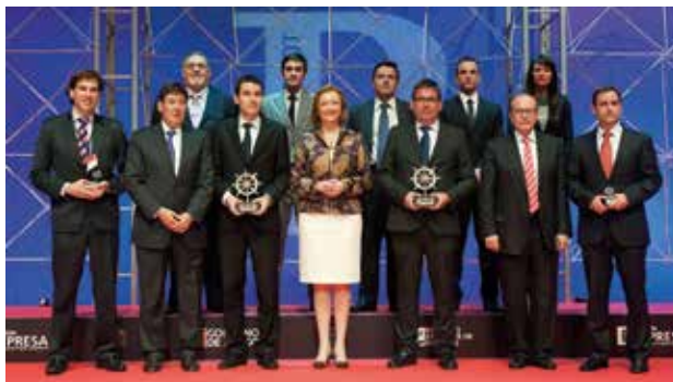
Finalistas, Ganadores del Premio Pilot 2013 y Autoridades

–Premio Pilot 2014 al mejor proyecto del Máster de Logística