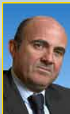
Luis de Guindos Director del Centro del Sector Financiero de PwC e IE Business School