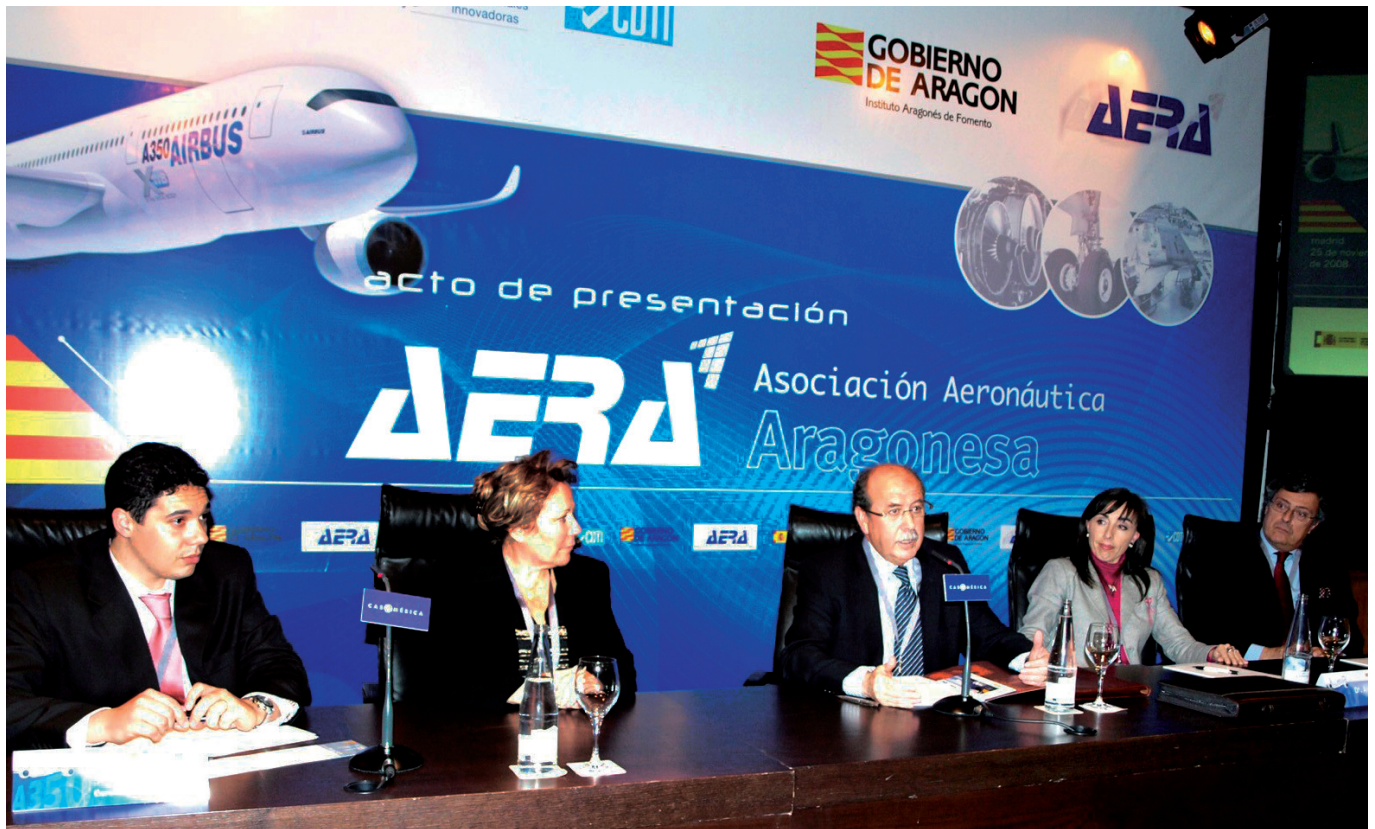
Acto de presentación del Cluster Aeronáutico en Madrid.