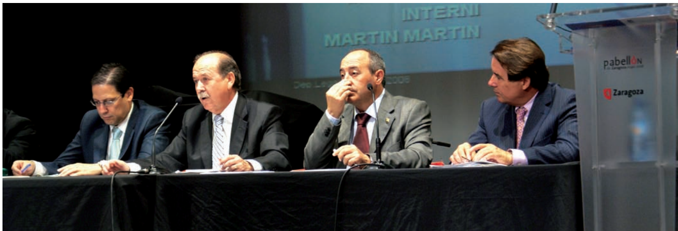
Septiembre 2008, Pabellón de Zaragoza en Expo.