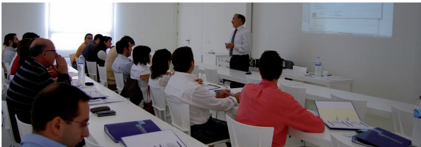
23 gestores de empresas franquiciadoras de Aragón realizaron la formación de Gestión Avanzada en Comunicación de Franquicias, en la Universidad San Jorge.